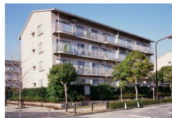
シーブリーズ金沢（金沢区）