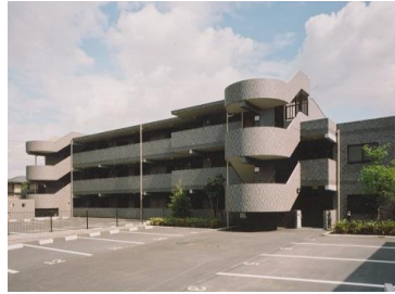
特定優良賃貸住宅 ヨコハマ・りぶいん ヒルズ青葉（青葉区） ※ルームシェア導入検討物件