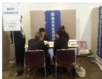
高齢者住み替え相談 パシフィコ横浜（西区）