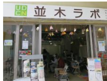
公社の空き店舗を活用した UDCN 並木ラボ （金沢センターシーサイド内）