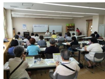
出前講座 南戸塚地域ケアプラザ（戸塚区）