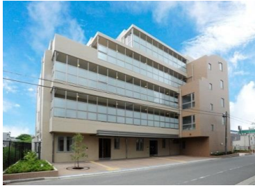
高齢者向け地域優良賃貸住宅 エスケイワイコート（金沢区）