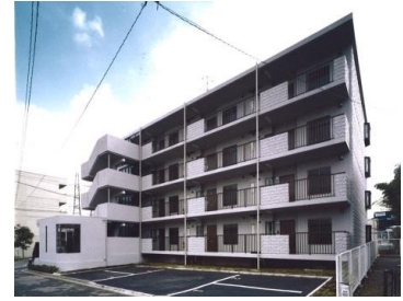
一般賃貸住宅 ヨコハマ・れんとす アルタいどのり（港南区） ※子育てりぶいん対象物件