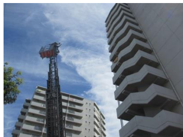
防災訓練 上瀬谷住宅（瀬谷区）