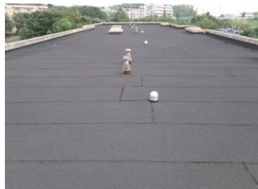
屋上防水工事 改修前 今宿ハイツ（旭区）