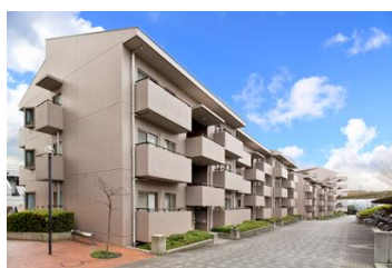
オクトス市ヶ尾（青葉区）