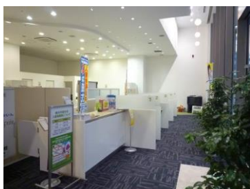
住まいるイン受付窓口

なお、平成 29 年 10 月頃、相談センターの移転・再オープンを予定しており、より一層の情報発信の強化と市民サービスの向上を図っていきます。