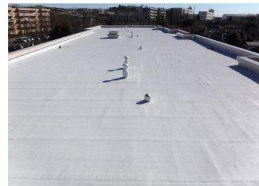
屋上防水工事 改修後 今宿ハイツ（旭区）