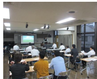
指定管理者連絡会 反町地域ケアプラザ（神奈川区）