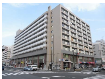
根岸駅前ビル（磯子区）