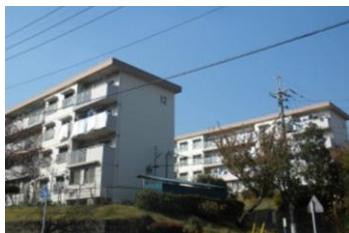
桜台団地（青葉区） 現況