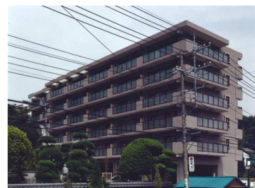
エクセレントコート三枝木（戸塚区）