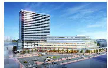
大船駅北第二地区市街地再開発事業（栄区） イメージパース