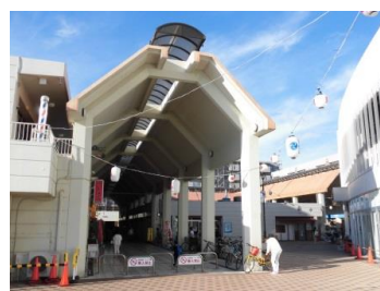
金沢センターシーサイド（金沢区）