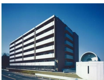
グランドヒルズ横浜（瀬谷区）