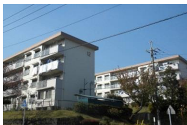
桜台団地（青葉区） 現況