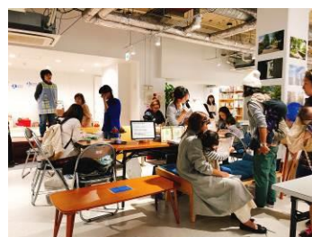
金沢センターシーサイドにあるエリマネ拠点「並木ラボ」