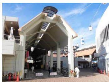
金沢センターシーサイド（金沢区）