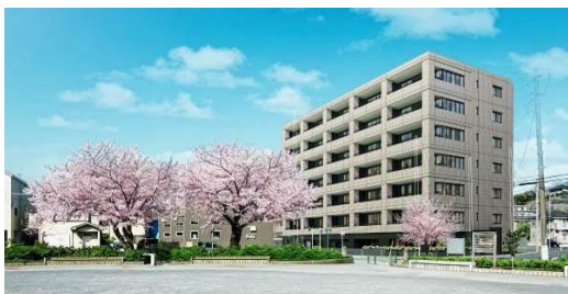
プロミライズ横浜井土ヶ谷（南区） イメージパース