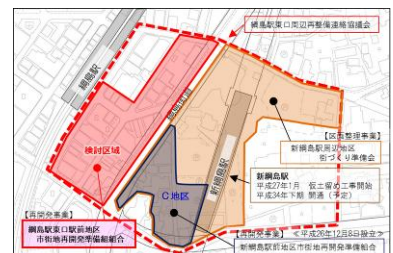
綱島駅東口駅前地区市街地再開発事業 （港北区）現況区域