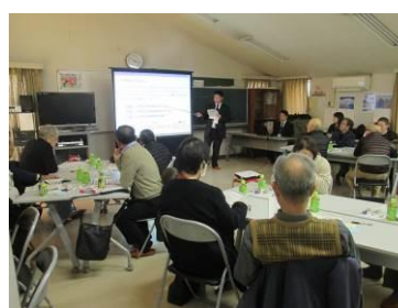
防災取組み勉強会