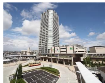
長津田マークタウン（緑区）