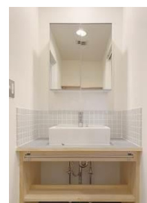
オクトス市ケ尾（青葉区） カスタマイズ賃貸住戸