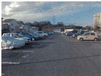
アスファルト舗装工事 改修前