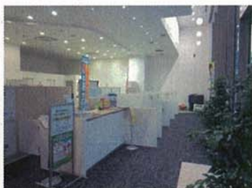
住まいるイン受付窓口

※住まい・まちづくり相談センターは、平成29年10月頃、移転・再オープンを予定しています。