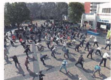
野庭団地広場でのラジオ体操