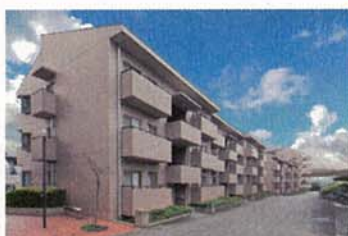
オクトス市ヶ尾（青葉区）