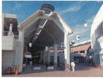
金沢センターシーサイド（金沢区）