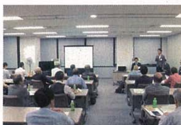
団地再生の進め方セミナー・相談会