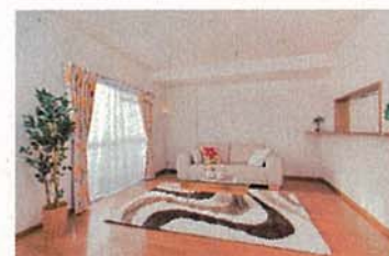
オクトス市ヶ尾モデルルーム ニトリとの協働