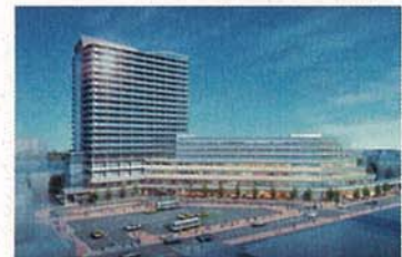
大船駅北第二地区市街地再開発事業（栄区） イメージパース