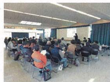
ぐみさわ東ハイツ（戸塚区） 出前講座・勉強会