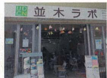
公社の空き店舗を活用した UDCN並木ラボ （金沢センターシーサイド内）