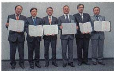
よこはま団地再生コンソーシアム 協定締結式

(仮称) 井土ヶ谷マンション管理組合については、当社が主催した「団地再生の進め方セミナー」への参加を機に、将来検討の必要性を学び、居住者が自ら考えて再生方針を決定しました。当社は、合意形成に向けて継続的に支援を行いました。