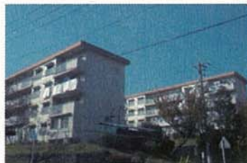
桜台団地（青葉区） 現況