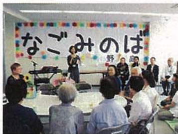
野庭団地地域交流拠点 なごみのば