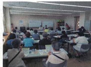
出前講座 南戸塚地域ケアプラザ（戸塚区）