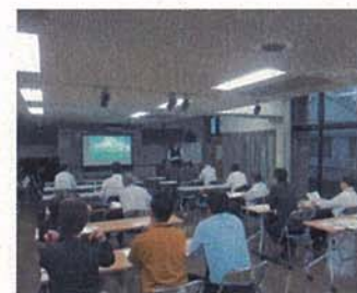
指定管理者連絡検討会 反町地域ケアプラザ（神奈川区）