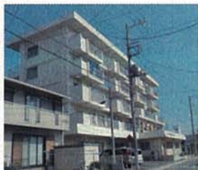
(仮称) 井土ヶ谷マンション (南区) 現況