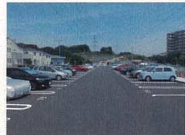
アスファルト舗装工事 改修後