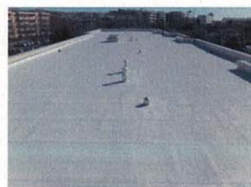
屋上防水工事 改修後 今宿ハイツ（旭区）