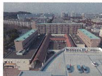
外壁塗装工事 改修後 さざなみ団地第二店舗併用住宅（金沢区）