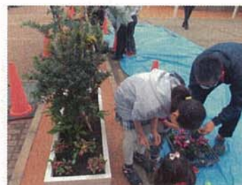
居住者による花植イベントの実施