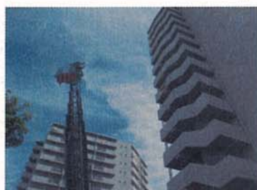
防災訓練 上瀬谷住宅（瀬谷区）