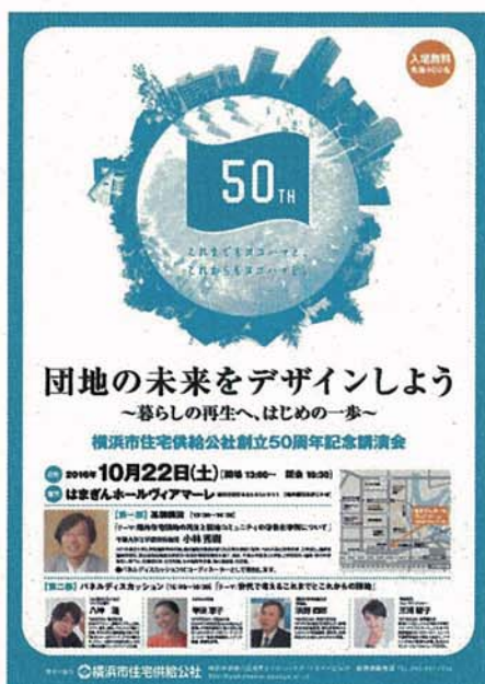
団地の未来をデザインしよう ~暮らしの再生へ、はじめの一歩~ はまぎんホールヴィアマーレ（西区）