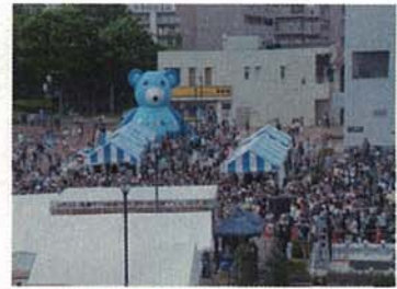
地域活性化の取り組み 金沢シーサイドタウンコミュフェス （金沢区）