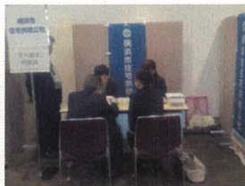
高齢者住み替え相談 パシフィコ横浜（西区）