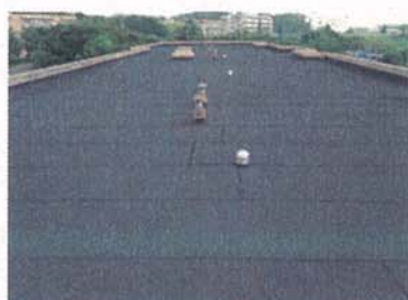
屋上防水工事 改修前 今宿ハイツ（旭区）