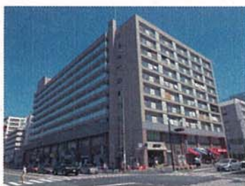
外壁塗装工事 改修後 根岸駅前ビル（磯子区）